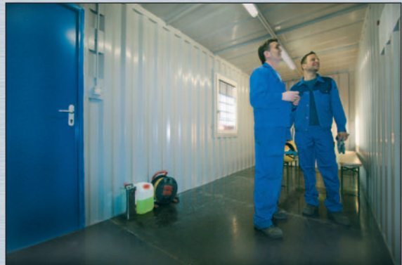
förrådscontainer med fönster och dörr