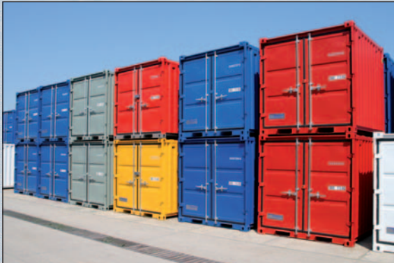
olika färger enligt CTX-RAL-kort