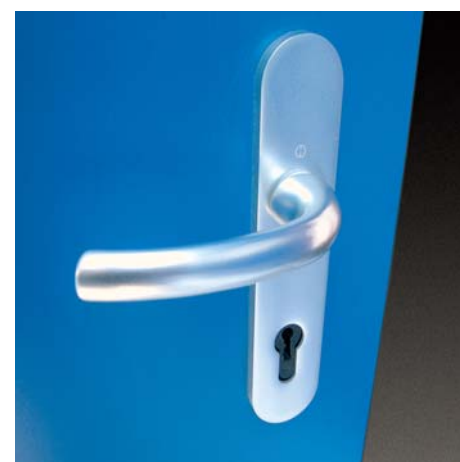
nouvelle poignée de porte (non démontable de l'extérieur)