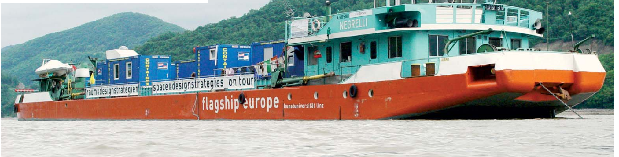
Le bateau MS Negrelli en voyage sur le Danube avec des conteneurs de location CTX comme cabines de bateau.