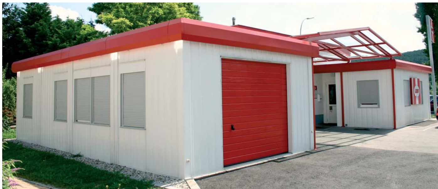
Local commercial et atelier de réparations du club automobile ARBÖ

Les solutions d'espace Containex répondent aux exigences les plus variées - désormais aussi pour le négoce de motos et de voitures, comme ateliers ou magasins de station service.