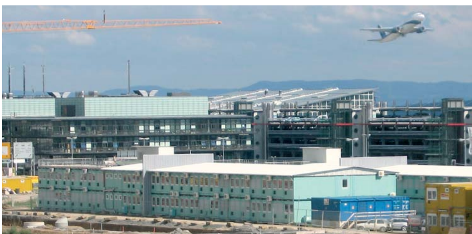
Bureau de planification de projects - chantier parc d'exposition à Stuttgart (D)

éprouvée sur les chantiers. En particulier, la mise en place rapide et les multiples possibilités d'extension convainquent les clients.