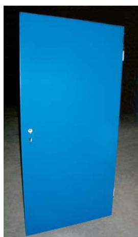
Tôle 0,8 mm (33% plus épais qu'auparavant)

clients sont enthousiasmés par cette innovation. Les nouvelles données techniques en détail: