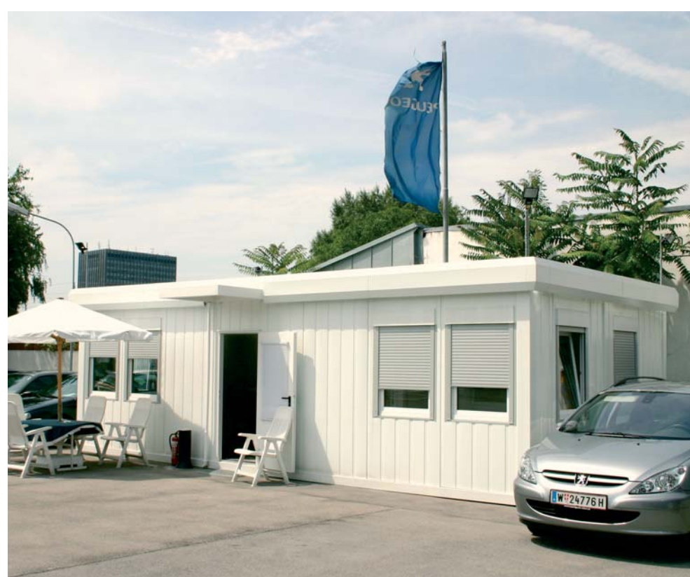
Concessionnaire automobile, Peugeot à Vienne