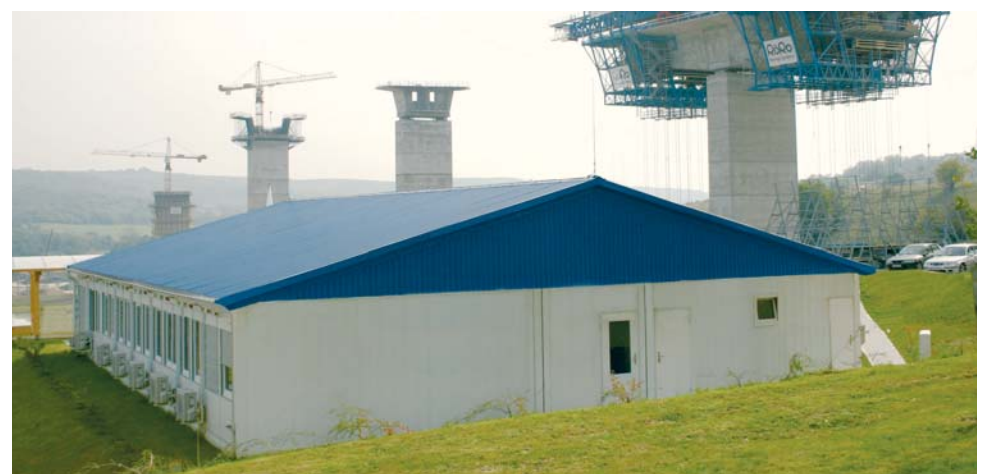
Bureau de chantier Hidepitö (Vinci) - Chantier Köröshegy (H)