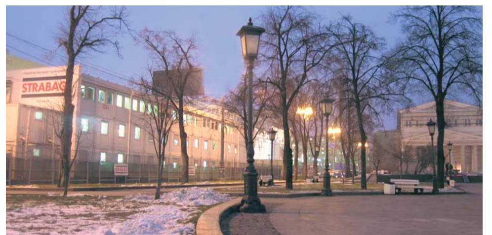
Bureau de chantier de la société Strabag - Théâtre Bolschoï Moscou (RF)