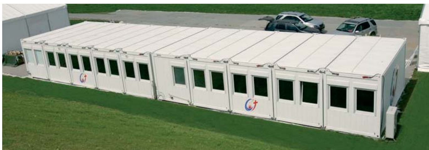
Ensemble de conteneurs à la Journée Mondiale de la Jeunesse à Cologne en 2005

Le Pape Benoît XVI y disposa d'une sacristie afin de se préparer dans le calme pour la messe. Les locaux ont été spécialement embellis sur place par un partenaire de Containex. A la fin de la Journée Mondiale de la Jeunesse, l'ensemble fut vendu aux enchères au plus offrant.