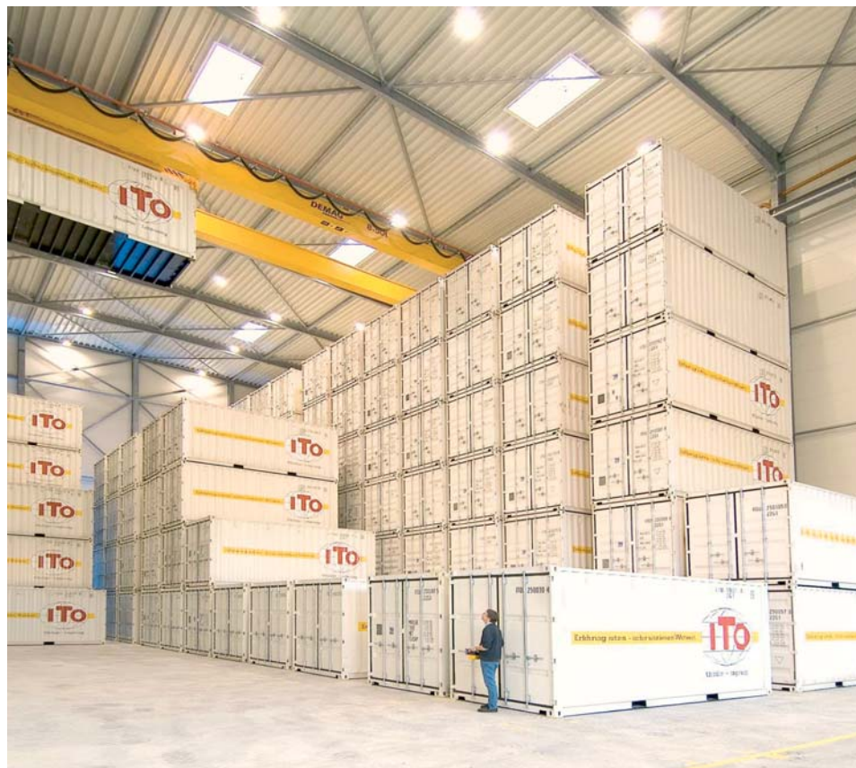
Conteneurs maritimes utilisés par un déménageur, Brème