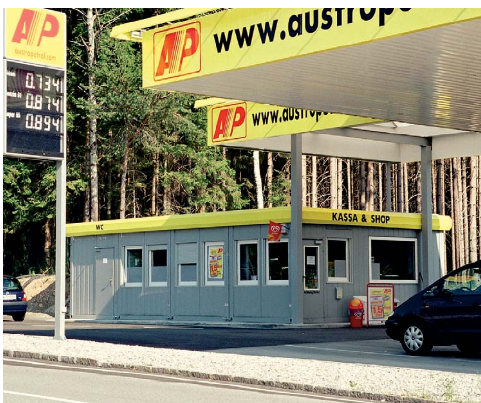
Magasin de station service et vestiaires, Station service Walserberg