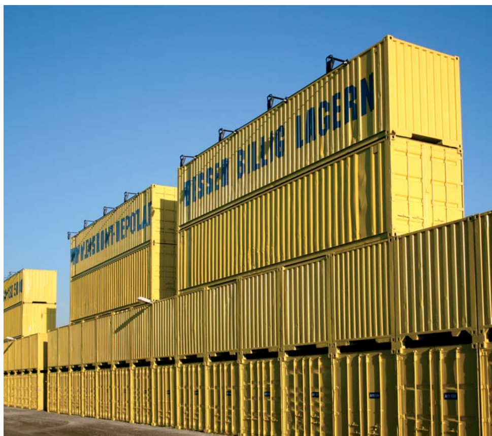
Conjunto para self storage, Viena

muebles, Containex ofrece equipamientos opcionales como por ejemplo listones interiores, mayor número de aperturas para ventilación así como colores especiales.