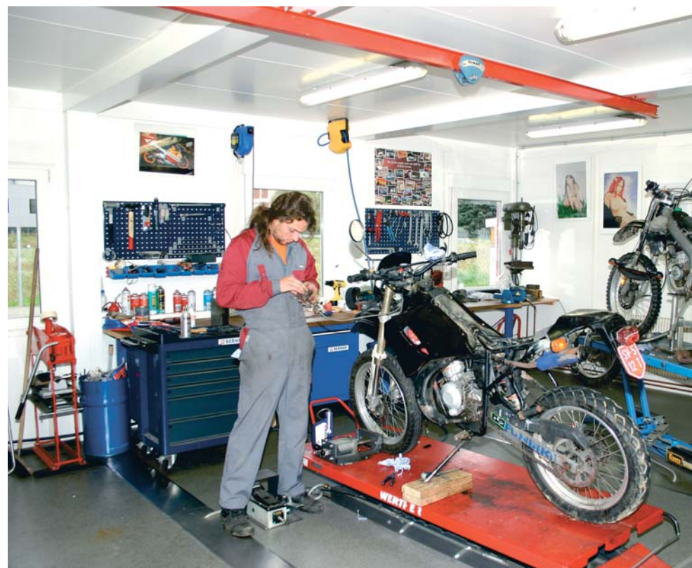
...y taller "Bikerbude"