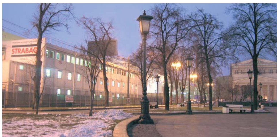
Oficina de obra Strabag - Teatro Bolschoj en Moscú (RF)