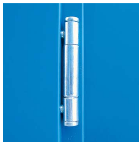
bisagra de 3 piezas