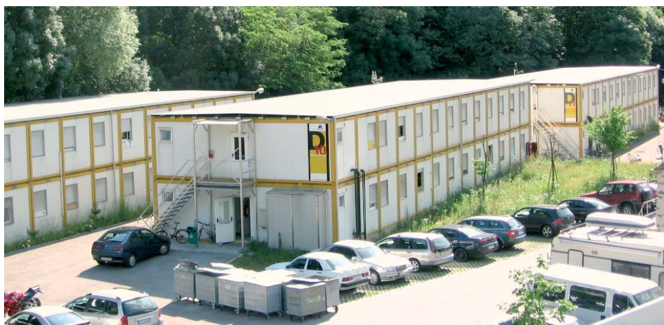
Alojamiento y oficinas de obra del consorcio TAT Gotthardtunnel (CH)