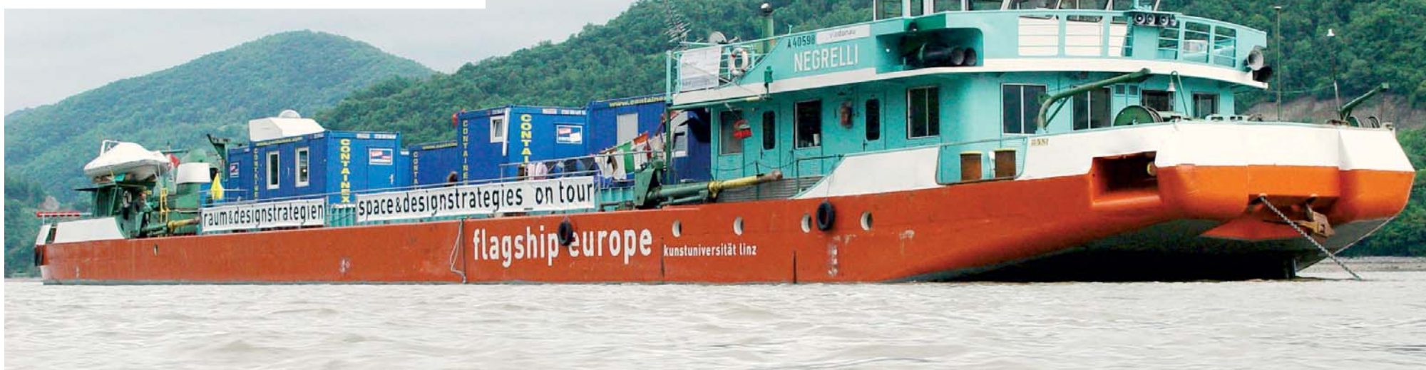
El MS Negrelli con Contenedores de alquiler CTX navegando por el Danubio.