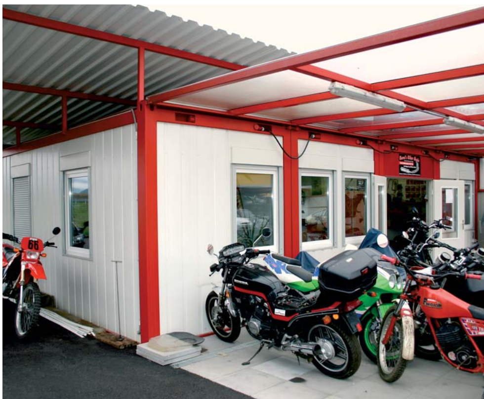
Centro de motos...

¡También la atractiva relación calidad-precio ha convencido a nuestros clientes!