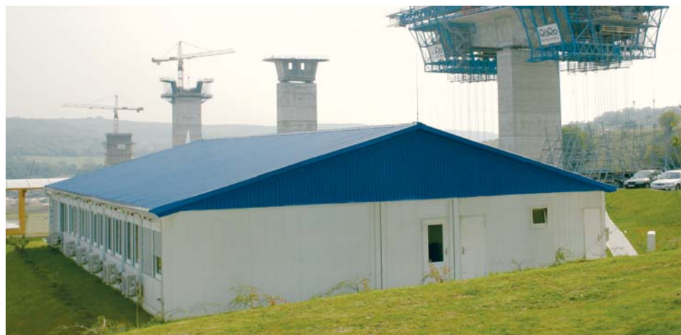
Oficina de obra Hidepito (Vinci) - Obra Koroshegy (H)